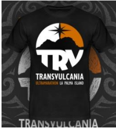
c) Diseño D