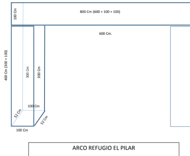
Ilustración 1. Croquis vinilado truss Lote 2

*Todas las lonas de este lote deben ser materiales biodegradables tanto en tinta como en soporte